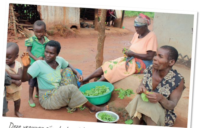
Deze vrouwen zijn druk met het bereiden van het eten van de dag