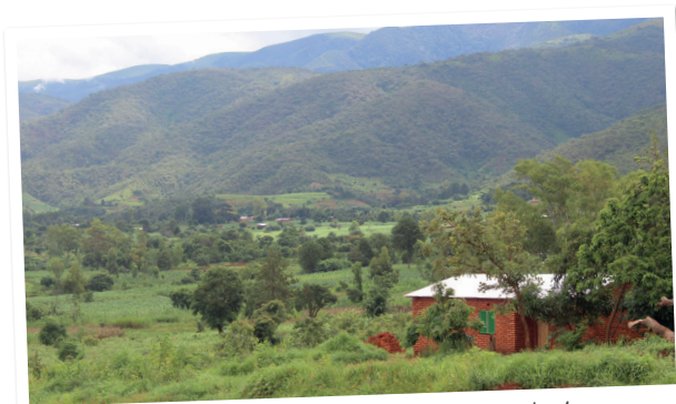
Mwalweni is een groen, heuvelachtig gebied

koffie en macadamia-noten worden verbouwd voor de verkoop. Helaas levert dit vaak te weinig op om van rond te komen en voor veel ouders is het keihard knokken om hun kinderen voldoende te eten te geven. De focus ligt op overleven, waardoor er weinig aandacht en mogelijkheden zijn voor opvoeden en gezond opgroeien. Er zijn weinig voorzieningen voor de allerkleinsten. Onder jongeren is de werkloosheid enorm. Ze hebben vaak hun school niet kunnen afronden, en missen training in belangrijke levensvaardigheden als samenwerken en doelen stellen - allemaal zaken die helpen om zelf in een inkomen te voorzien.